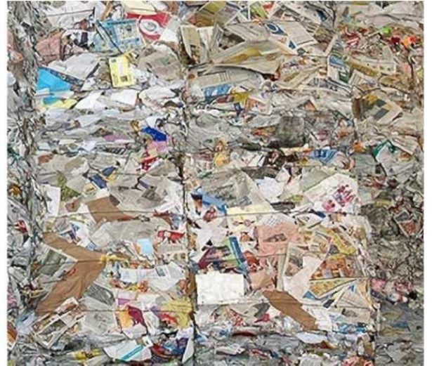
1. Deșeuri de hârtie și carton