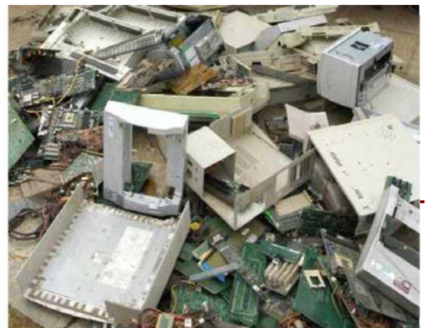
2. Deșeuri de plastice și metale