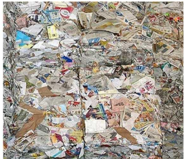
1. Deșeuri de hârtie și carton